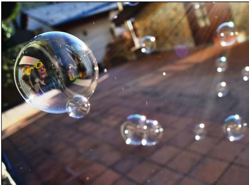
El Reflex - Eva Fernandes - Foto guanyadora del Concurs UdArt de Fotografia