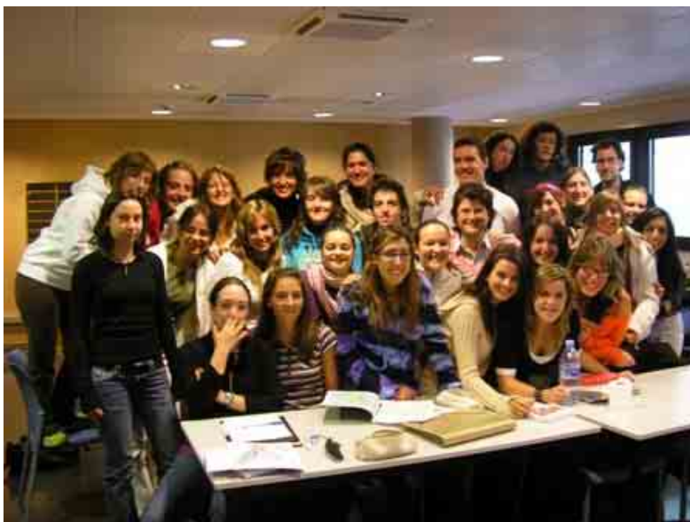
Alumnes de 1r curs de ciències de l'educació