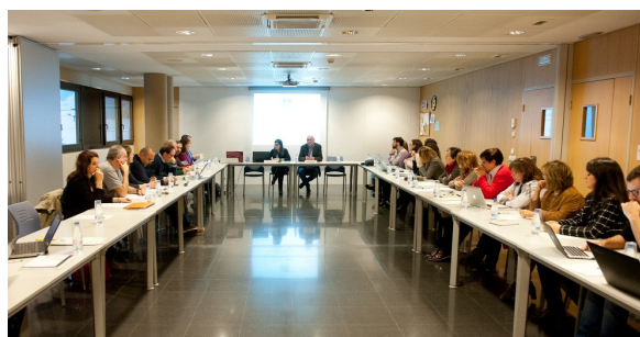
Grup de recerca interdisciplinari en educació

Esperem que el curs vinent puguem organitzar una tercera edició. Us animem a tots a proposar temes d'interès per a l'edició de l'any vinent.