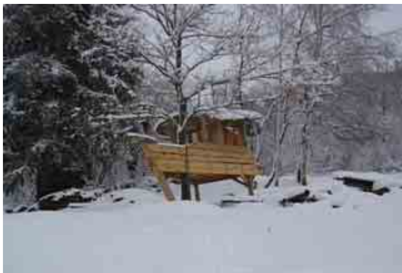
La Souleillane arbre-vaixell situat al cor del parc nacional Pyrénées Ariègoises. Saurat. Obra natural de Pierre-Marie Girard.