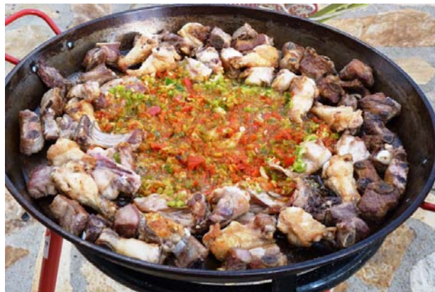
2. Bons ingredients