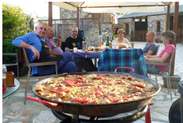
4. Bona companyia i ganes de gresca