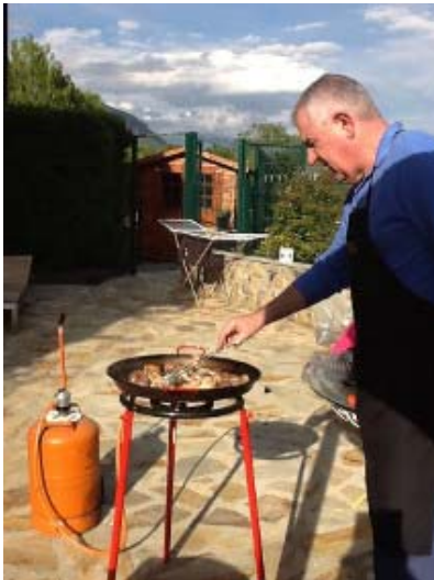
1. Un bon cuiner

Ingredients per a la paella d'estiu a l'aire lliure