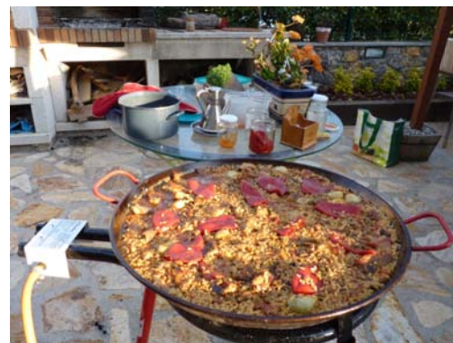
3. Un bon xup xup