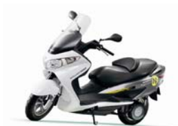
Scooter Suzuki de 125cc que utilitza una pila d'hidrogen per a alimentar el motor elèctric. Presentada en el saló de l'automòbil de Tokyo el 2010.