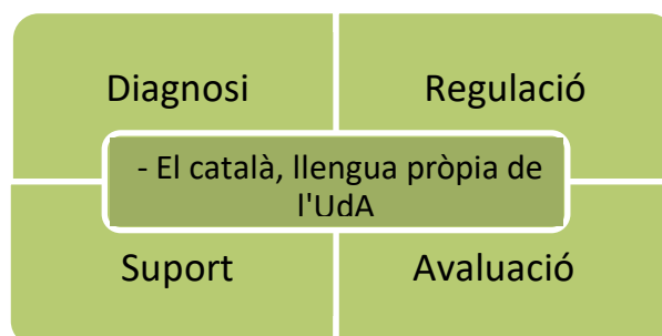
Fig. 1. Dos eixos d'actuació, quatre objectius transversals