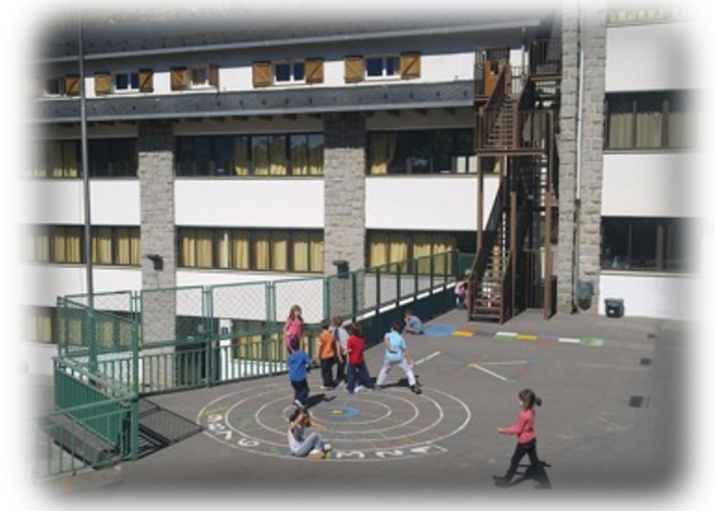
Escoles de Sant Julià de Lòria