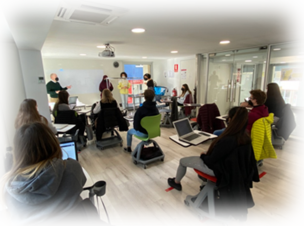
Sessions a l'UdA, abril 2022